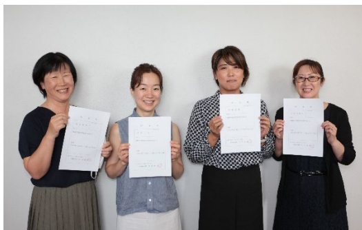
① 女性委員の集合写真

※写真を差し替える際は、コメントについても適宜変更をお勧めします。委員会の連絡先などでも構いません。